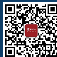
澳科大 EMBA 微信公眾號