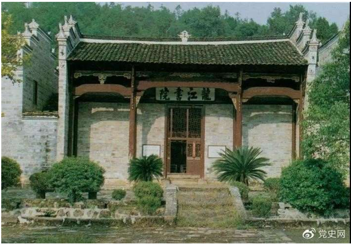
宁冈龙江书院。1928年4月朱德和毛泽东会师，曾在这里长谈。